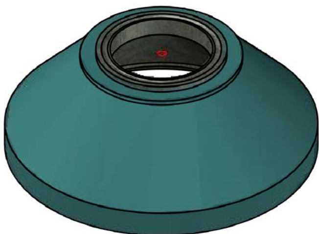
ISOHATT™ 1600 SENTRISK