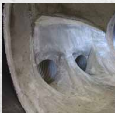
Eksempel for Flexi 4 // Hovedløp DN 800 DV X-tream og 2 stk. sideløp DN 200 DV X-tream